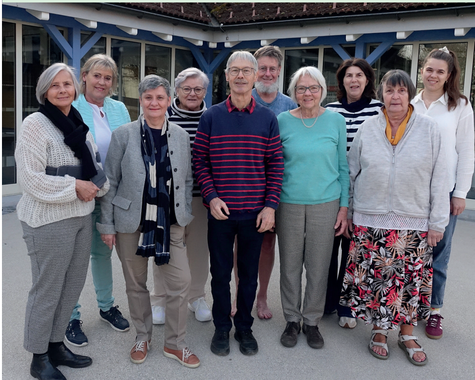
Die Aktivmitglieder von «Solidarität für eine Welt».

vor Ort ein. Mit dem Beitrag von «Solidarität für eine Welt» werden qualitativ hochwertige Hilfsmittel wie Rollstühle, Handschienen und Gehtrainer bereitgestellt sowie Arbeitsmöglichkeiten an behindertengerechten Arbeitsplätzen geschaffen. Die bedürftigen Kinder