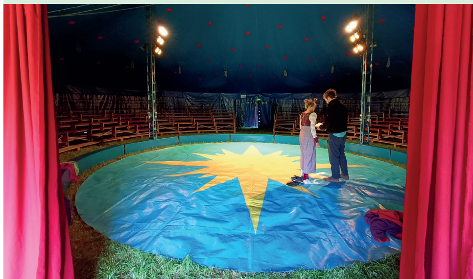
Das Zirkuszelt – aussen bunt ...